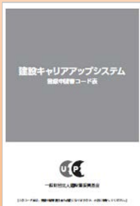
技能者のコード表