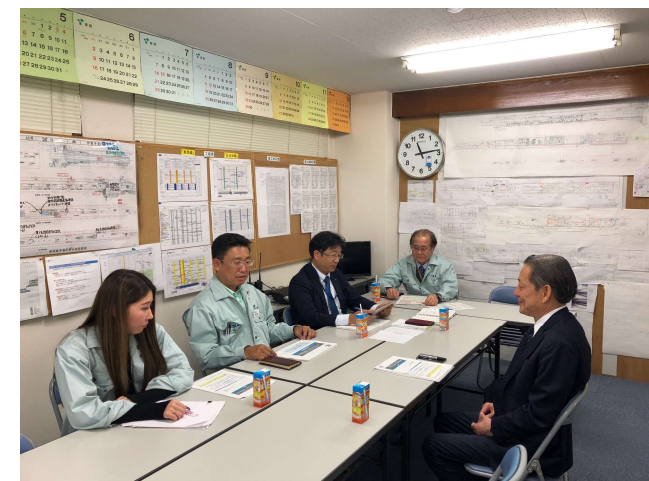
本社を交えて登録の代行申請の促進会議を実施