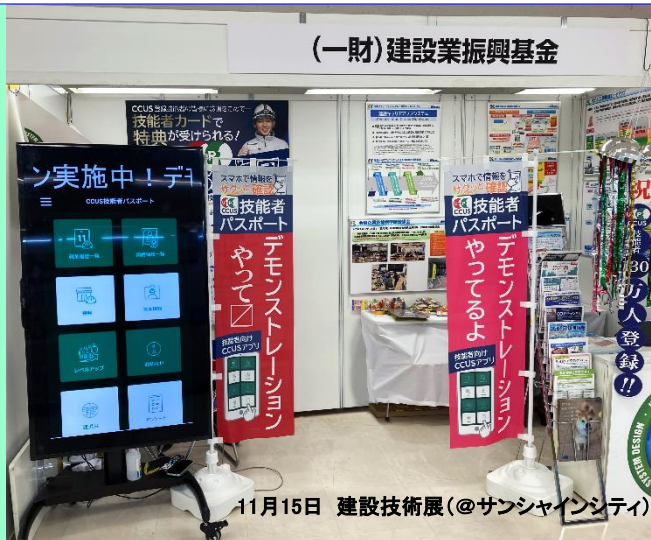
11月15日 建設技術展(@サンシャインシティ)

全国で活躍するCCUS認定アドバイザーの意見交換会が11月24日に当財団において開催されました(参加者数75名)。